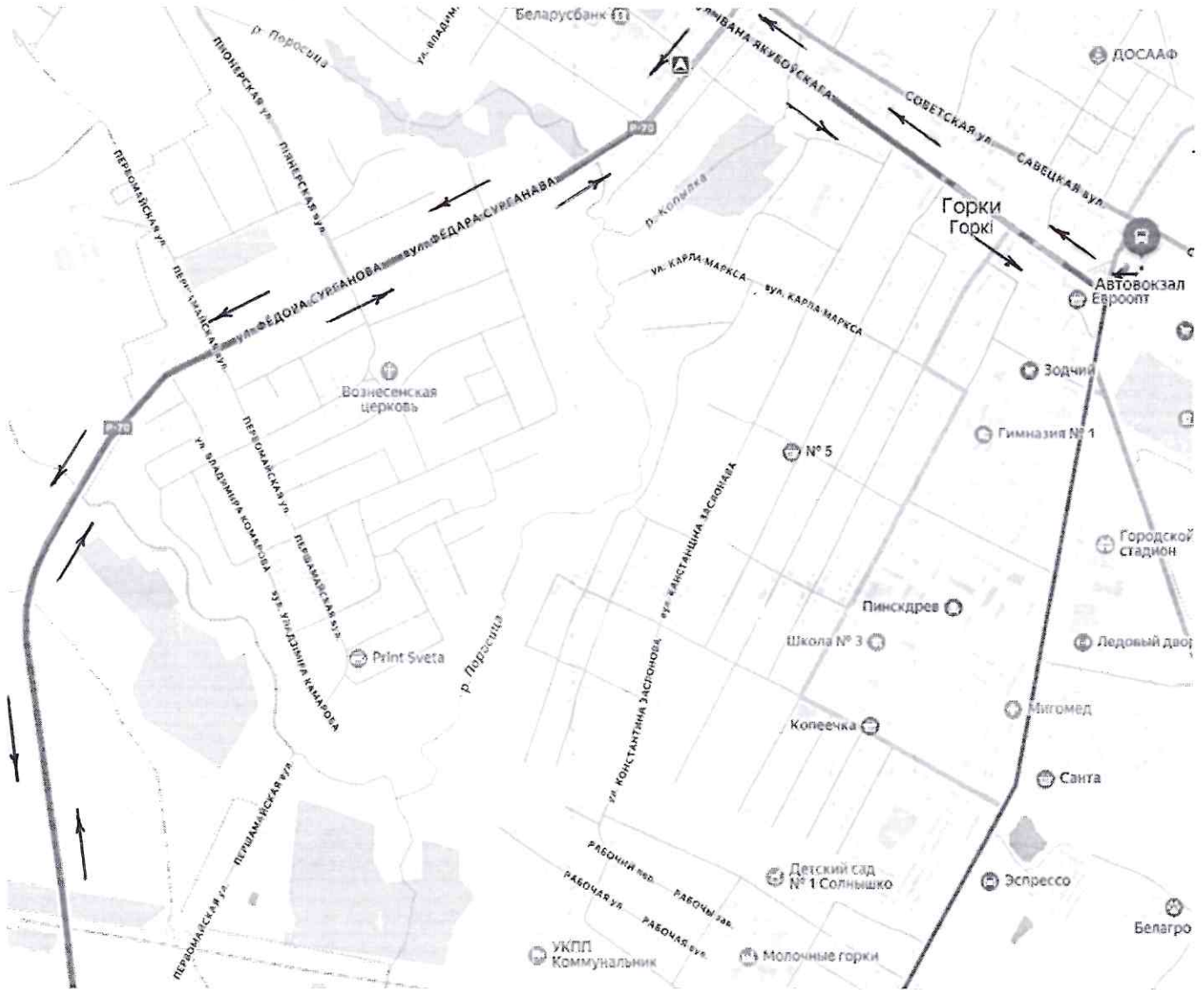
Схема маршрута №620-ТК «Горки – Могилев» через Шклов (участок: проезд по г. Горки)