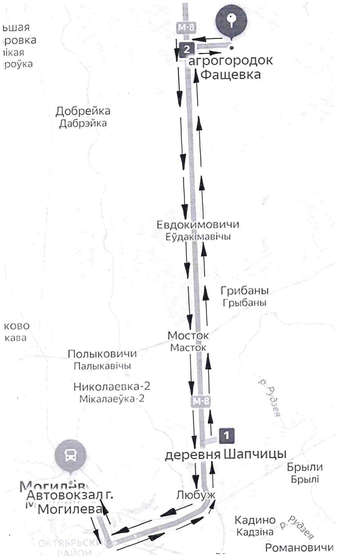
СХЕМА ПРИГОРОДНОГО МАРШРУТА № 266 «МОГИЛЕВ-ФАЩЕВКА» (общий вид)